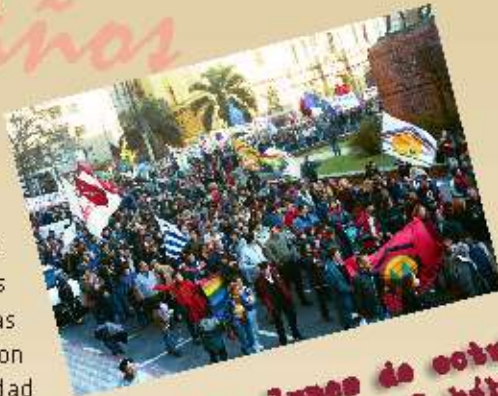
primer lunes de octubre: día mundial del hábitat

La membresía está abierta a organizaciones populares, ONG, centros voluntarios, instituciones de educación e investigación que suscriban los objetivos y políticas de HIC y cuyas actividades se relacionen con la vivienda, la ciudad y los derechos humanos vinculados al hábitat.